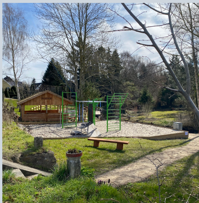
Foto: Harndrup - Åhaven med legepladsen

https://middelfart.dk/politik/byrad/styrelsesvedtaegt/