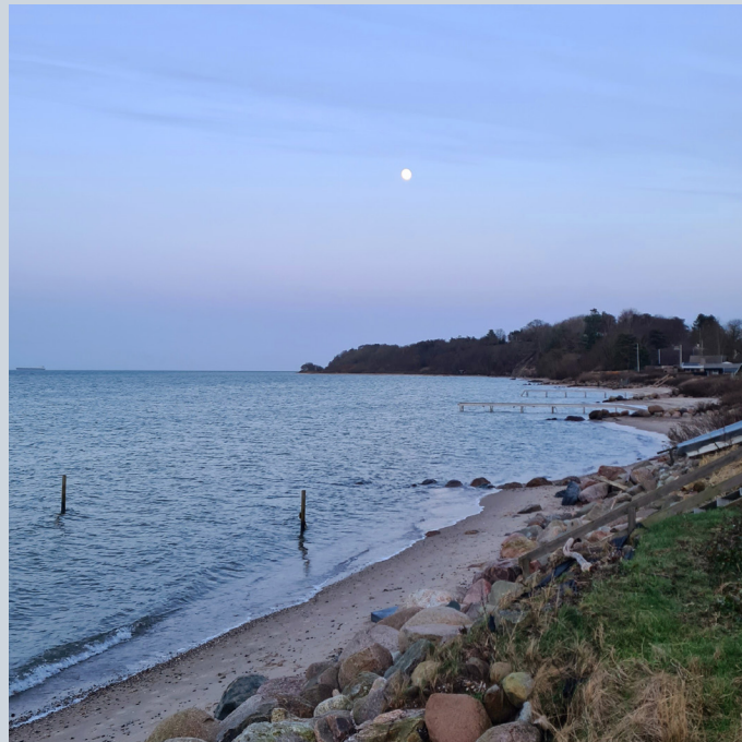
Dæmningen